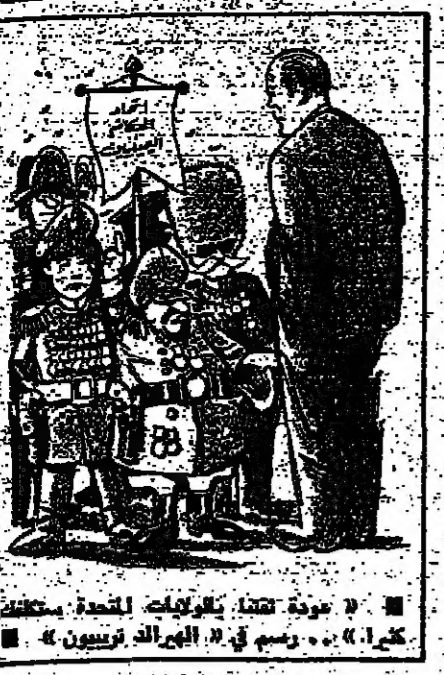
« عودة هاتوي برفقة اولادها الى هانوي » . رسم في « الهerald تريون » .